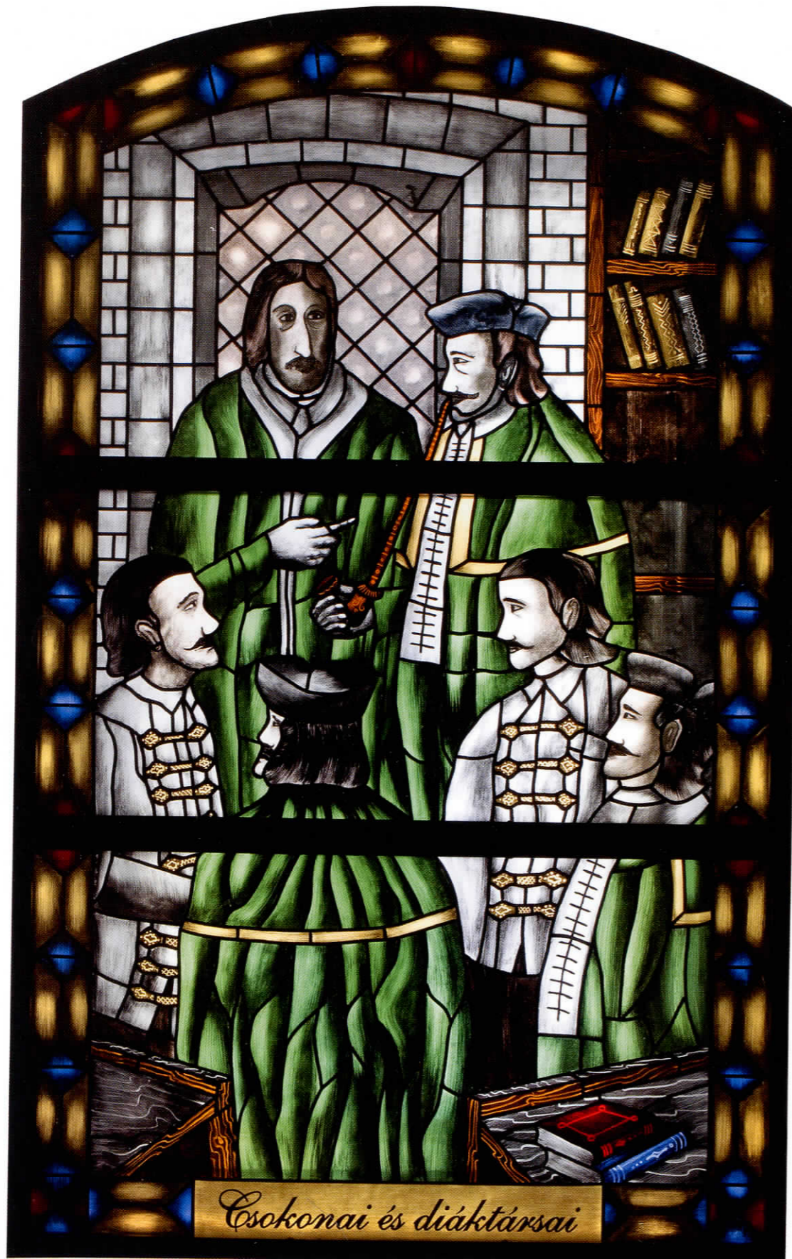
Csokonai és diáktársai