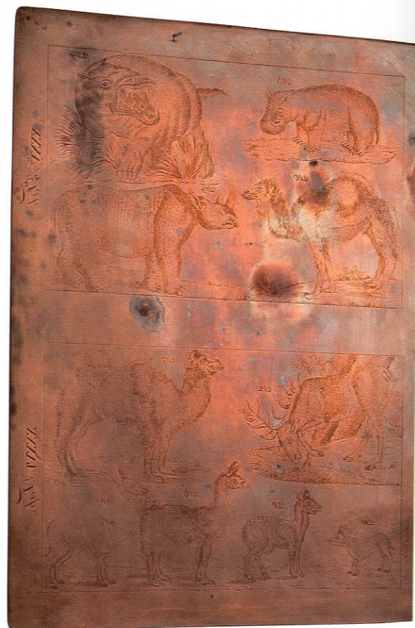
Természetrajzi illusztrációk a rézmetszők munkáiból