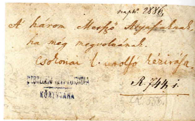
Levele a rézmetsző atyafiakhoz

A rézmetsző diákok közül többen Csokonai tanulóársai, jó barátai voltak. Élete egyik legnehezebb szakaszában hónapokat töltött kis házukban, halálos betegen hozzájuk címezte egyik utolsó levelét. Az Alföld grafikai hagyományait megalapozó, a művészetet az oktatás szolgálatába állító ifjak közül kerültek ki első illusztrátorai.