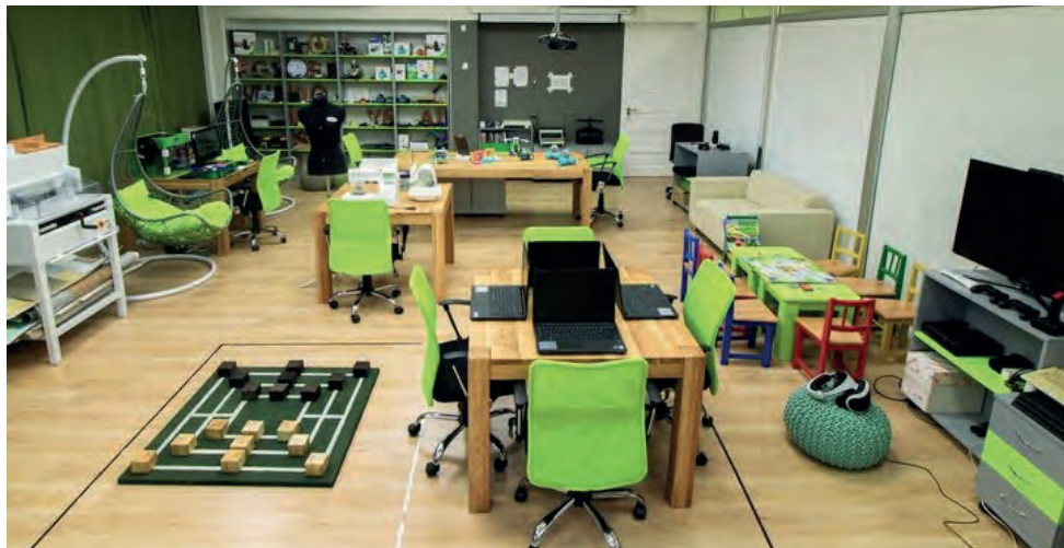
Digilabor – a Békés Megyei Könyvtár honlapjáról

látogatójegyükkel ingyenesen látogatható, azonban a felmerülő anyagköltséggel számolni kell. Lehetőség van 3D-s nyomtatásra, a robotika alapjainak elsajátítására, a mikroelektronika megismerésére, vagy akár közös foglalkozás keretében világító képeslap is készíthető. A tevékenység működésének fő célja az alkotás, újítás, újrahasznosítás megismertetése és gyakorlatba való átültetése. A bemutatott fejlesztés lehetőséget biztosít szabadidős foglalkozások, csoportprogramok szervezésére, az Iskola Közösségi Szolgálat is teljesíthető itt. A Könyvtári Intézettel közösen gyakorló könyvtárosok részére „ Makerspace a könyvtárakban ” című képzést alakítottak ki, ahol könyvtárosok ismerkedhetnek meg a lehetőségekkel és meríthetnek ötleteket. A Digilabor nyújtotta lehetőségekről további információk a Békés Megyei Könyvtár honlapján olvashatók. ▶