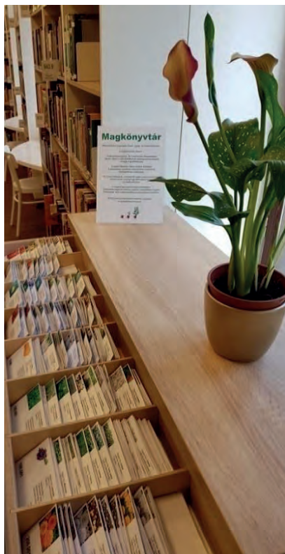
Magkönyvtár – képek a bemutató ppt-ből

Azonban ezen túl kiemelt szempont volt, hogy az öko-szemlélet a könyvtár mindennapjaiban is fontos szerepet töltsön be. Ehhez kapcsolódó hívszavak, amelyeket a könyvtárosok szem előtt tartottak: a fenntartható fejlődés, a környezetvédelem és környezetudatos magatartás népszerűsítése. Kialakítottak a könyvtár udvarán zöld olvasótermet, amely nemcsak azt jelenti, hogy az olvasók szabad téren, árnyas fák alatt olvashatnak, lapozhatnak bele kötetekbe, hanem azt is, hogy a gyűjtemény gyarapításánál a környezetvédelem és a zöld szemlélet hangsúlyosan jelen van. Mindezen szemlélet érvényesítésében az önkormányzat zöld elköteleződése is segítette a könyvtárosokat. A könyvtár partnerként részt vesz a zöld kezdeményezésekben, ilyenek például a Passzold vissza! Beporzók Napja . Programjait, rendezvényeit is