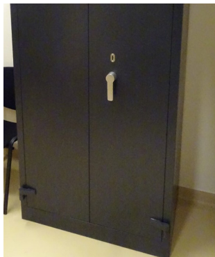
A védett raktár a pánccel-szekrényvel