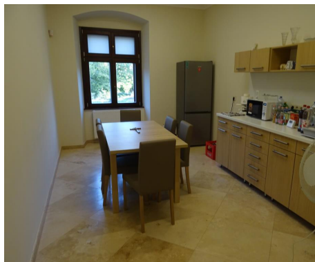
A könyvtár kis konyhája Rózsakerti kilátással

Mellette a nyugati szárnyon a kutató helyén levő nagyszobából egy gipszkarton fallal leválasztott egy egyablakos kis konyha-ebédlő helyiség következik, amelyet egy nagyobb és egy kisebb raktár követ. Az épület ezen, nagyobb mennyiségű könyvek tárolására kialakított szárnyát a hatalmas terhelődés miatt mintegy 20–30 centiméterrel megvasalták.