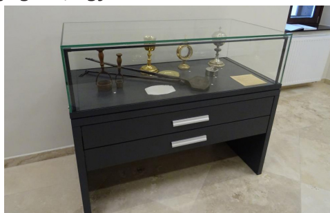
Egy 18. századi könyvtári enteriőr – a Tárgyaló