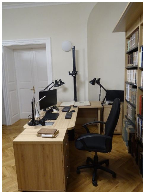
A Gyűjteményi Raktár és Digitalizáló

A második nagy alapterületű szobába került a Gyűjteményi Raktár és a Digitalizáló. Ide került az eredeti helyszínen is az 1990-es évek során kiemelt helyismereti / egyházmegye-történeti anyag, amely voltaképpen Pécs város és a Pécsi Egyházmegye méret szerint rendezett (PA, PB, PC, PD, PE) másodlagos szakirodalmi és folyóirat-anyaga. Az állomány nagysága és dokumentumtípus alapján kiemelésre került a magyar nyelvű, főként egyházi folyóiratállomány. Ezeket a gyűjteménytестeket a fentről egyedi megvilágítással rendelkező új, fakeretes, 3 centiméterenként állítható antracitszürke fém, nyitott polcos könyvespolcon rendeztük. A Gyűjteményi Raktár a Digitalizáló könyvtári munkatárs munkaszobája is egyben, munkaasztalánál a fényképezőgépes reprodukciós berendezések találhatók.